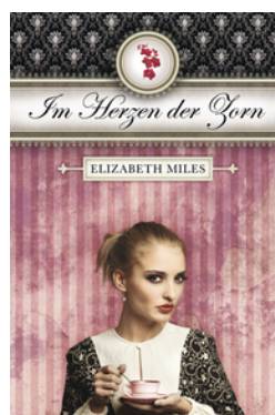
Furien-Trilogie – Im Herzen der Zorn (Band 2)