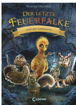
Der letzte Feuerfalke und die Unterwelt (Band 11)