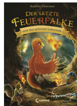
Der letzte Feuerfalke und das geheime Labyrinth (Band 10)