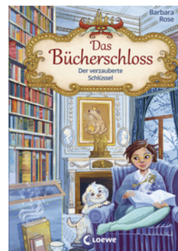
Das Bücherschloss (Band 2) - Der verzauberte Schlüssel