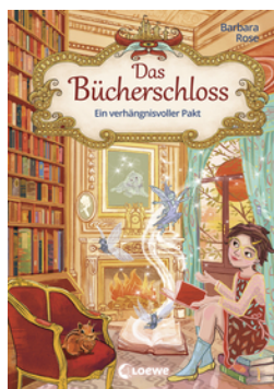
Das Bücherschloss (Band 4) - Ein verhängnisvoller Pakt