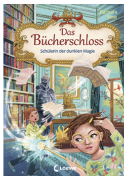
Das Bücherschloss (Band 6) - Schülerin der dunklen Magie