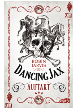
Dancing Jax – Auftakt