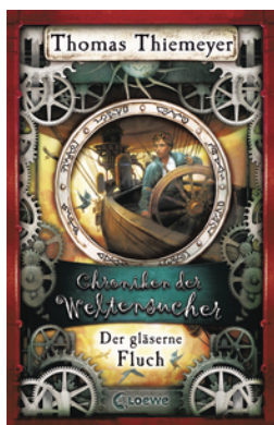
Chroniken der Weltensucher - Der gläserne Fluch