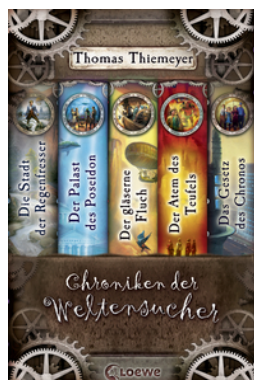
Chroniken der Weltensucher - Die komplette Reihe