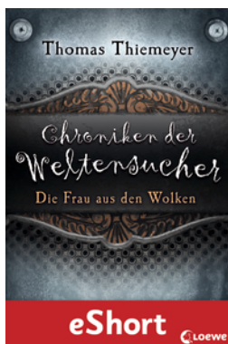
Chroniken der Weltensucher - Die Frau aus den Wolken