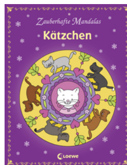
Zauberhafte Mandalas - Kätzchen