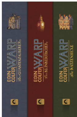
WARP - Die komplette Trilogie