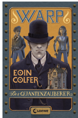
WARP (Band 1) - Der Quantenzauberer