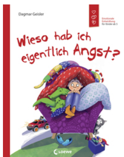
Wieso hab ich eigentlich Angst?