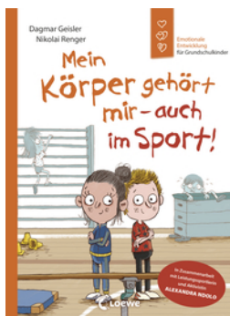
Emotionale Entwicklung für Grundschul Kinder - Mein Körper gehört mir - auch im Sport!