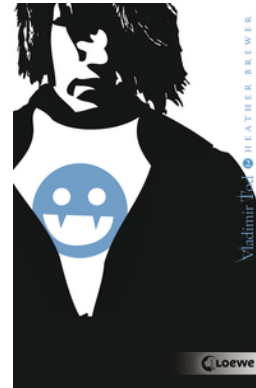
Vladimir Tod beisst sich durch (Band 2)