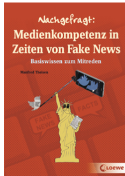
Nachgefragt: Medienkompetenz in Zeiten von Fake News