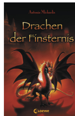
Drachen der Finsternis