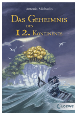
Das Geheimnis des 12. Kontinents