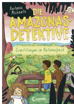
Die Amazonas-Detektive (Band 4) - Ermittlungen im Nationalpark