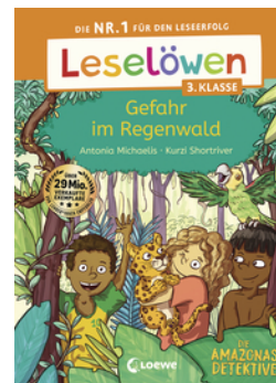
Leselöwen 3. Klasse - Amazonas-Detektive: Gefahr im Regenwald