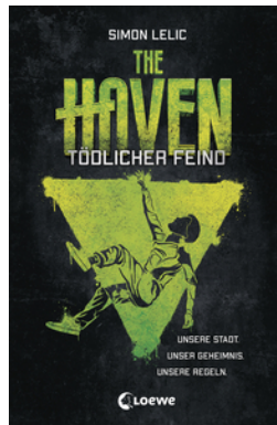
The Haven - Tödlicher Feind