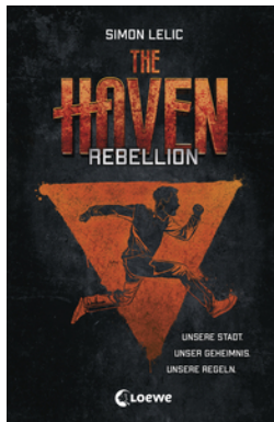
The Haven - Rebellion