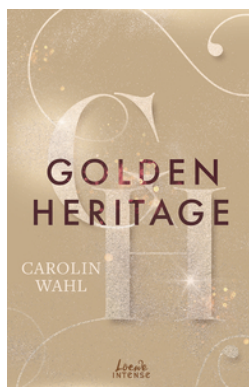
Golden Heritage (Crumbling Hearts, Band 2)