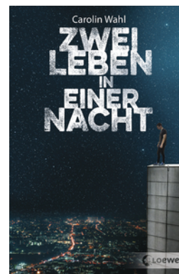
Zwei Leben in einer Nacht