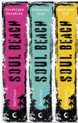
Soul Beach - Die komplette Trilogie