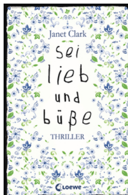
Sei lieb und büße