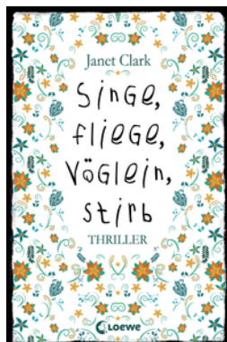
Singe, fliege, Vöglein, stirb