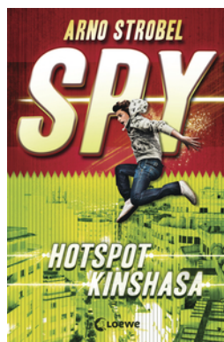
SPY (Band 2) - Hotspot Kinshasa