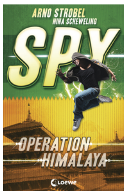
SPY (Band 3) - Operation Himalaya