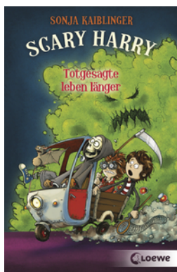
Scary Harry (Band 2) - Totgesagte leben länger