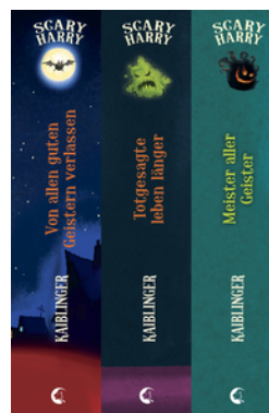
Scary Harry (Band 1-3)