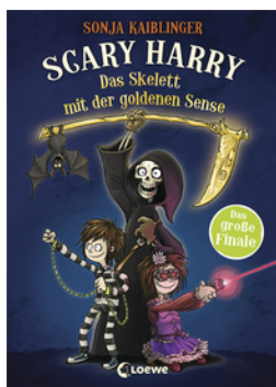
Scary Harry (Band 9) - Das Skelett mit der goldenen Sense