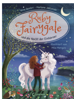
Ruby Fairygale und die Nacht der Einhörner (Erstlese-Reihe, Band 4)