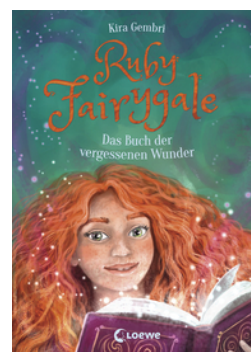
Ruby Fairygale (Band 8) - Das Buch der vergessenen Wunder