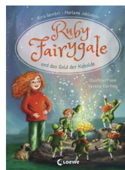
Ruby Fairygale und das Gold der Kobolde (Erstlese-Reihe, Band 3)