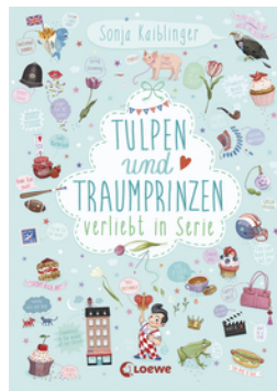
Tulpen und Traumprinzen – Verliebt in Serie