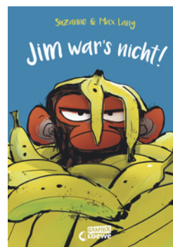
Jim war's nicht!