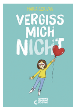
vergiss mich nicht (nicht genug-Reihe, Band 2)