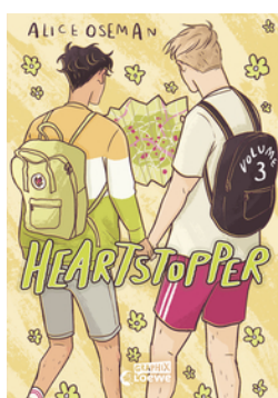
Heartstopper Volume 3 (deutsche Hardcover- Ausgabe)