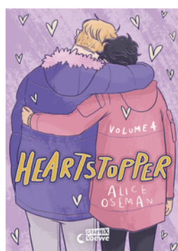
Heartstopper Volume 4 (deutsche Hardcover- Ausgabe)