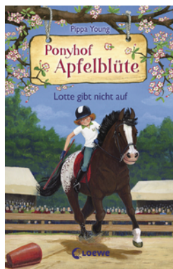
Ponyhof Apfelblüte (Band 23) - Lotte gibt nicht auf