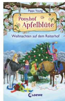
Ponyhof Apfelblüte - Weihnachten auf dem Reiterhof