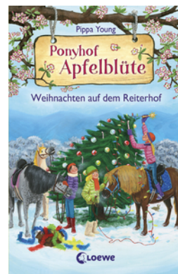
Ponyhof Apfelblüte - Weihnachten auf dem Reiterhof