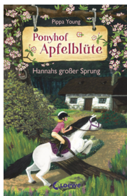
Ponyhof Apfelblüte (Band 24) - Hannahs großer Sprung