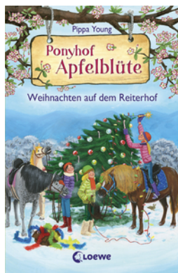
Ponyhof Apfelblüte - Weihnachten auf dem Reiterhof