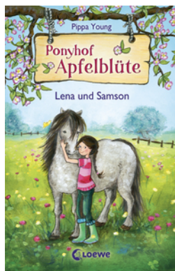
Ponyhof Apfelblüte (Band 1) - Lena und Samson