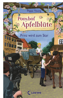
Ponyhof Apfelblüte (Band 25) - Prinz wird zum Star