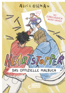
Heartstopper - Das offizielle Malbuch