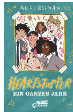
Heartstopper - Ein ganzes Jahr (Yearbook)