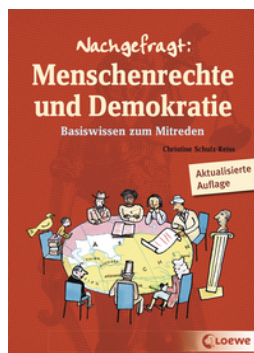
Nachgefragt: Menschenrechte und Demokratie