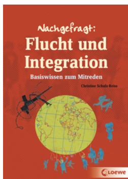
Nachgefragt: Flucht und Integration