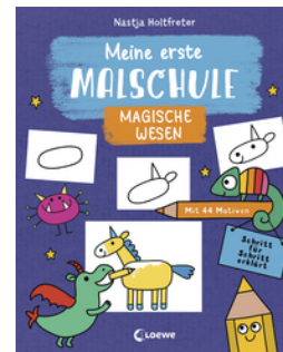
Meine erste Malschule - Magische Wesen