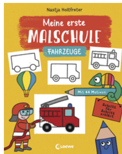
Meine erste Malschule - Fahrzeuge