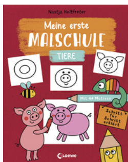
Meine erste Malschule - Tiere