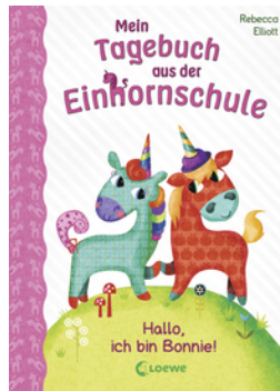
Mein Tagebuch aus der Einhornschule (Band 1) - Hallo, ich bin Bonnie!