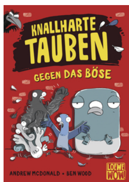
Knallharte Tauben gegen das Böse (Band 1)