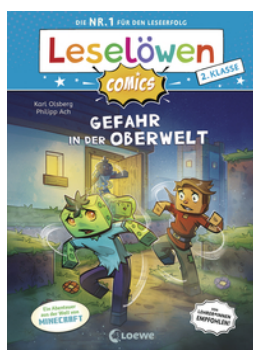
Leselöwen Comics 2. Klasse - Gefahr in der Oberwelt