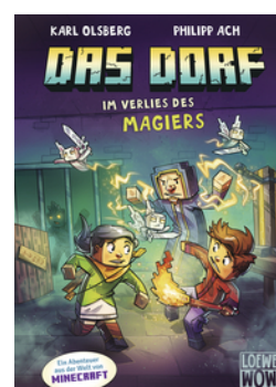
Das Dorf (Band 7) - Im Verlies des Magiers