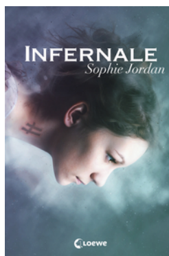
Infernale (Band 1)