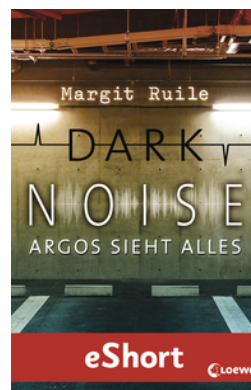
Dark Noise - Argos sieht alles