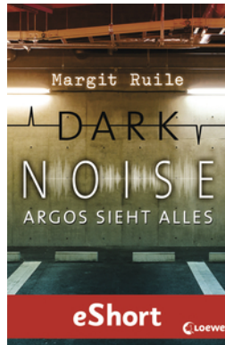
Dark Noise - Argos sieht alles