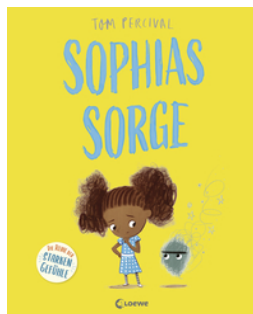
Sophias Sorge (Die Reihe der starken Gefühle)