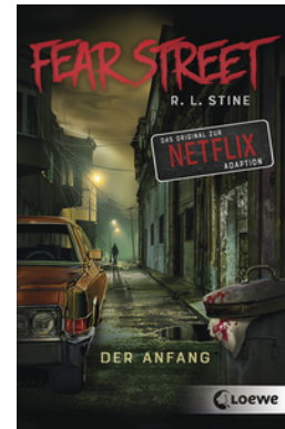
Fear Street - Der Anfang