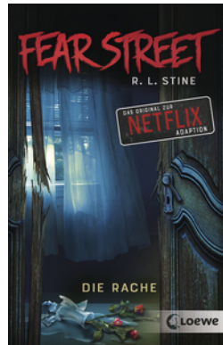
Fear Street - Die Rache