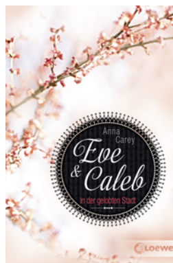
Eve & Caleb (Band 2) – In der gelobten Stadt