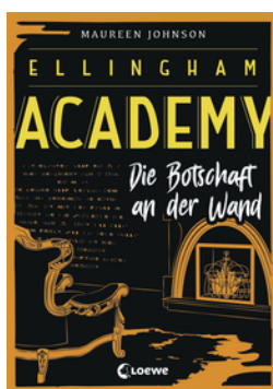
Ellingham Academy (Band 3) - Die Botschaft an der Wand