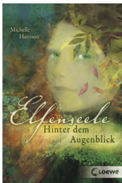
Elfenseele – Hinter dem Augenblick