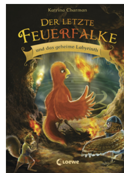
Der letzte Feuerfalke und das geheime Labyrinth