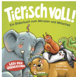
Tierisch voll! - Ein Bilderbuch zum Mitraten und Mitlachen