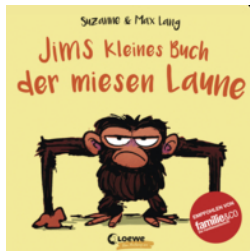
Jims kleines Buch der miesen Laune