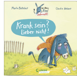
Der kleine Esel Liebernicht - Krank sein? Lieber nicht!