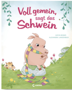
Voll gemein, sagt das Schwein