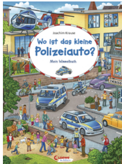
Wo ist das kleine Polizeiauto?