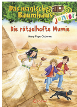
Das magische Baumhaus junior (Band 3) - Die rätselhafte Mumie