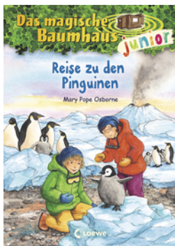
Das magische Baumhaus junior (Band 37) - Reise zu den Pinguinen