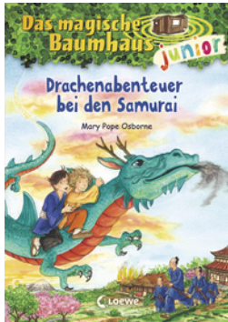
Das magische Baumhaus junior (Band 34) - Drachenabenteuer bei den Samurai