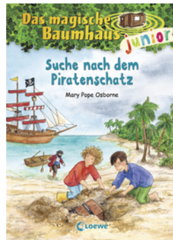
Das magische Baumhaus junior (Band 4) - Suche nach dem Piratenschatz