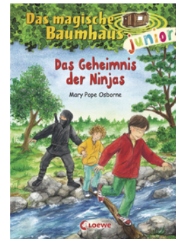
Das magische Baumhaus junior (Band 5) - Das Geheimnis der Ninjas