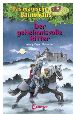
Das magische Baumhaus 2 - Der geheimnisvolle Ritter