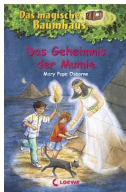
Das magische Baumhaus 3 - Das Geheimnis der Mumie