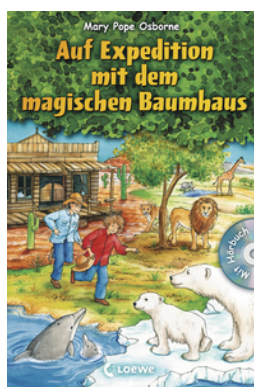
Das magische Baumhaus - Auf Expedition mit dem magischen Baumhaus (Bd. 9-12)