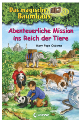
Das magische Baumhaus - Abenteuerliche Mission ins Reich der Tiere (Bd. 43-46)