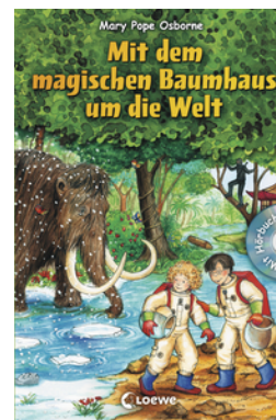
Das magische Baumhaus - Mit dem magischen Baumhaus um die Welt (Bd. 5-8)