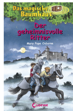
Das magische Baumhaus (Band 2) - Der geheimnisvolle Ritter