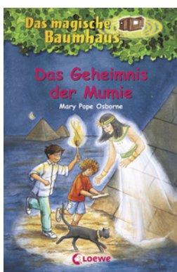
Das magische Baumhaus (Band 3) - Das Geheimnis der Mumie