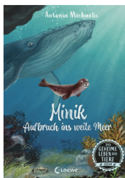
Das geheime Leben der Tiere (Ozean, Band 1) - Minik - Aufbruch ins weite Meer