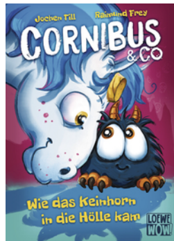
Cornibus & Co. (Band 4) - Wie das Keinhorn in die Hölle kam