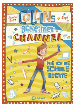
Collins geheimer Channel (Band 2) - Wie ich die Schule rockte