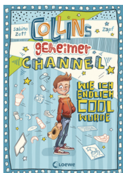
Collins geheimer Channel (Band 1) - Wie ich endlich cool wurde