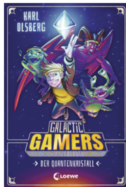
Galactic Gamers (Band 1) - Der Quantenkristall