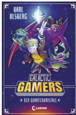
Galactic Gamers - Der Quantenkristall