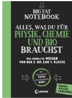
Big Fat Notebook - Alles, was du für Physik, Chemie und Bio brauchst - Das geballte Wissen von der 5. bis zur 9. Klasse. Mit Bonuswissen: Erdkunde