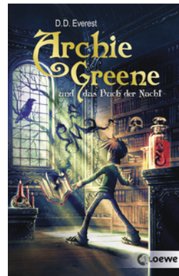
Archie Greene und das Buch der Nacht (Band 3)