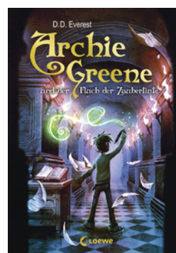
Archie Greene und der Fluch der Zaubertinte (Band 2)