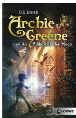
Archie Greene und die Bibliothek der Magie (Band 1)